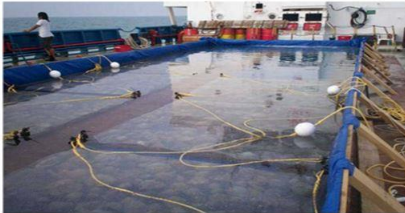
شکل ۱: انتقال مرجان ها در محفظه های آبی و ایجاد حوضچه در عرشه کشتی (Kilbane et al., 2008) Figure 1: The transfer of corals in water chambers and the creation of ponds on the deck (Kilbane et al., 2008)