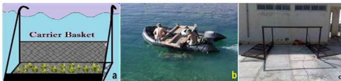
شکل ۲: سبد قدیمی انتقال مرجان (a و b) اقتباس از هاوایی (Carrier Basket) (Paul et al., 2005) و ساخته شده توسط کارشناسان موسسه تحقیقات علوم شیلاتی کشور در مرکز تحقیقات شیلاتی چابهار (c)