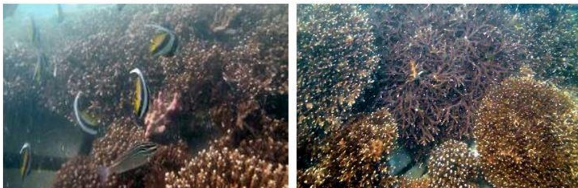
شکل ۷: تصاویری از پایش سایت مرجان ها در خلیج چابهار