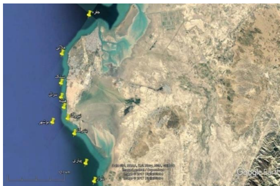
شکل ۱: نقشه منطقه و موقعیت ایستگاه‌های مورد بررسی Figure 1: Map of the studied region and sampling stations

(Richardson, 1977) انجام شد. در آزمایشگاه کلیه نمونه ها به کمک کلیدهای معتبر از جمله (Todd and Laverack, 1991; Smith and Johnson, 1996; Chihara and Murano, 1997; Al-Yamani et al. , 2011) و با استفاده از میکروسکوپ اینورت نیکون مدل Ti-S شناسایی و شمارش گردیدند.