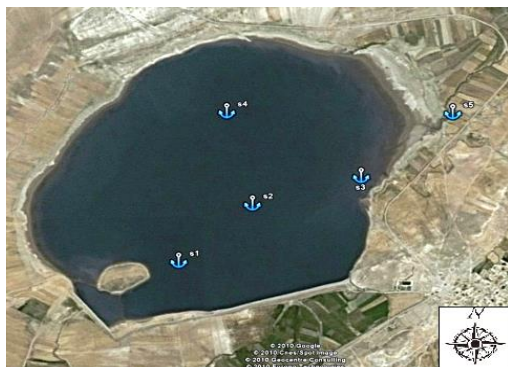
شکل ۱: ایستگاه‌های دریاچه سد مخزنی اردلان

این پژوهش ارزیابی خصوصیات زیستی و غیر زیستی دریاچه و اقلیم منطقه به‌منظور امکان دستیابی به تولیدی مطلوب‌تر بود.