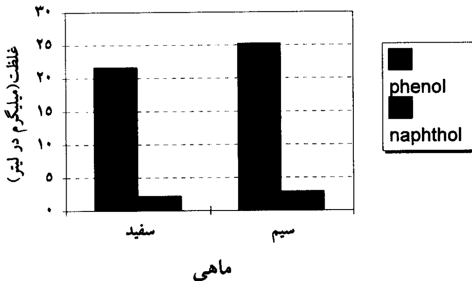
نمودار ۳: مقایسه سمیت فنل و ۱-نفتول برای ماهیان مختلف