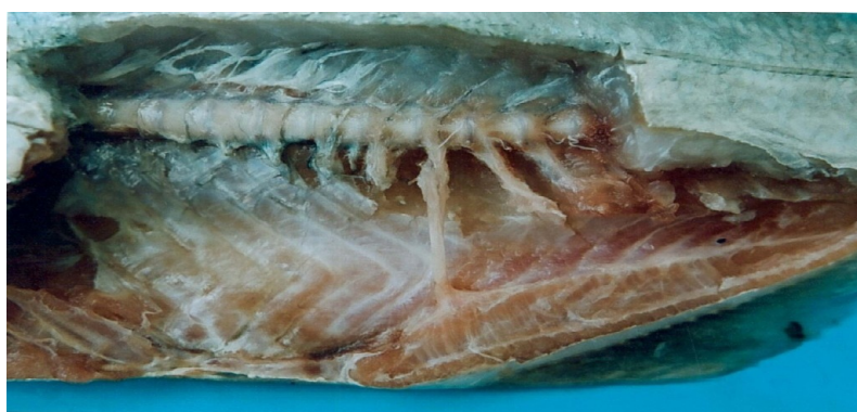
شکل ۲: موقعیت استخوان لنگری و مهره دهم داخل بدن ماهی گیش کاذب