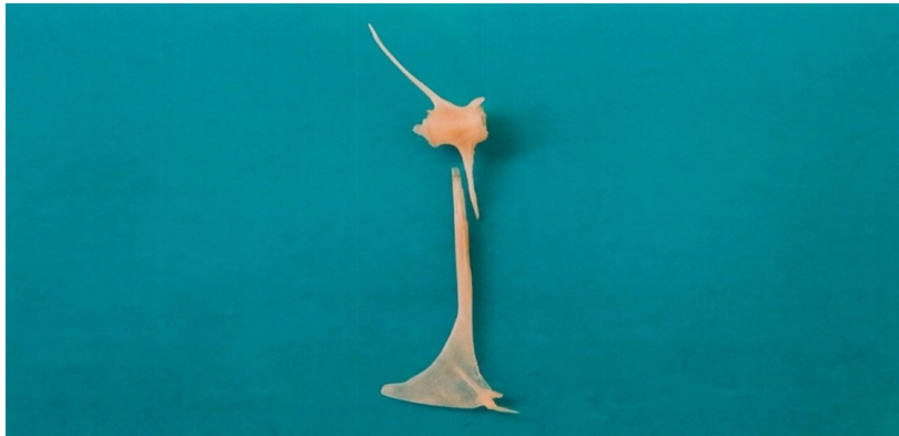
شکل ۴: استخوان لنگری و مهره دهم