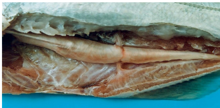
شکل ۱: وضعیت قرار گرفتن استخوان لنگری داخل کیسه شنا در بدن ماهی گیش کاذب

شده نشان دادند که این استخوان همانند لنگری برای کیسه شنا کاربرد داشته و بعنوان مرکز ثقل ماهی در قاعده باله مخرجی عمل می‌کند و با استحکام بخشیدن به قسمت زیرین بدن ماهی، به حرکت آن روی سطوح سخت سهولت می‌بخشد. این ویژگی منحصرأ در این جنس و گونه ماهی دیده می‌شود (Alam et al., 1989). کیسه شنای این ماهی از سمت انتهایی دو شاخه نمی‌باشد و در قسمت پیشین دو برآمدگی داشته که به پایه مجمله متصل می‌شود و قسمت انتهایی آن مخروطی شکل و فاقد زوائد بوده و در ماهیان بالغ تقریباً تا انتهای پسین باله مخرجی امتداد می‌یابد و از قسمت پشتی به شعاع‌های ۱۷-۱۶ تا ۲۳-۲۴ باله مخرجی می‌رسد (Alam et al., 1989).