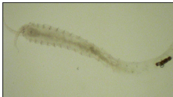
شکل ۴: کرم پرتار Parhypania brevispinis

جدول ۲: میانگین ( \pm انحراف استاندارد) تراکم و زیتوده ماکروبتوزها در اعماق و فصول مختلف