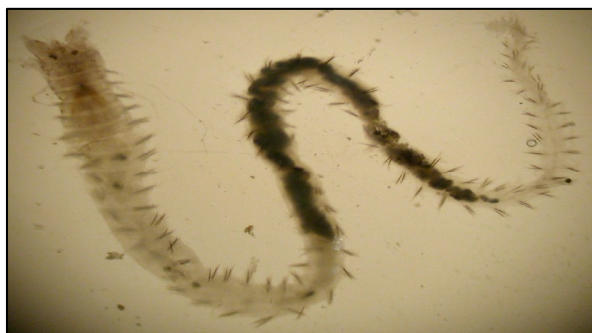
شکل ۳: کرم پرتار Nereis diversicolor