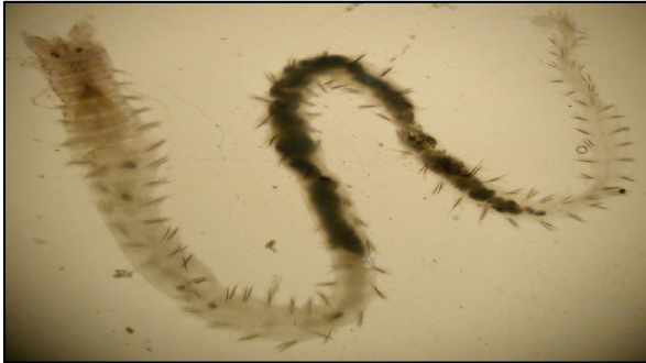
شکل ۳: کرم پرتار Nereis diversicolor