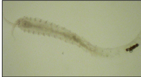
شکل ۴: کرم پرتار Parhypania brevispinis

جدول ۲: میانگین ( \pm انحراف استاندارد) تراکم و زیتوده ماکروبتوزها در اعماق و فصول مختلف