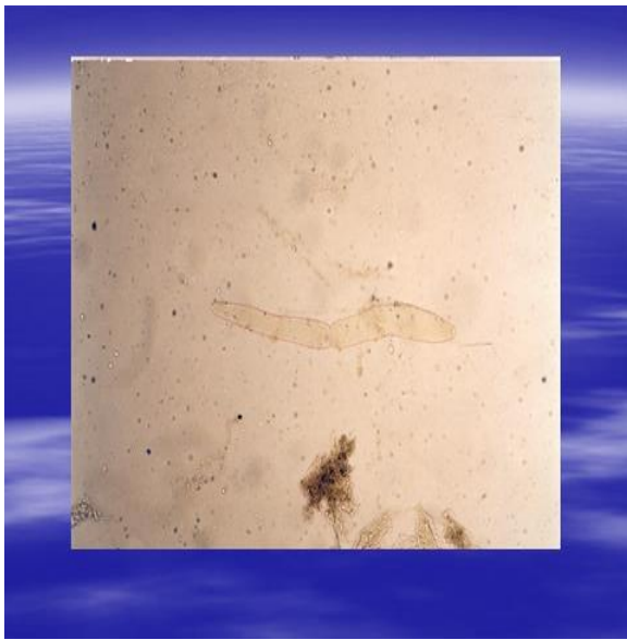
شکل ۲: مرحله تروفوزوئیت انگل گرگارین جداشده از میگوی سفید هندی (۱۰۰ برابر).