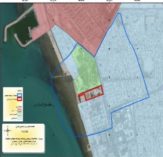
شکل ۲: محدوده مطالعاتی ایستگاه های تحقیقاتی بندرگاه (بالا) و خلیج فارس (پائین)، شهرستان بوشهر، ۹۳-۱۳۹۱.