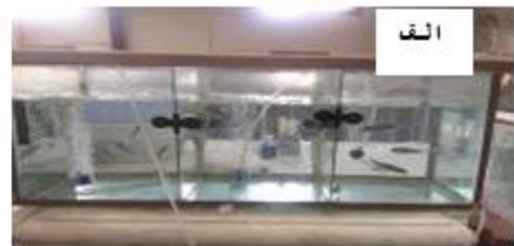
شکل ۳: الف: آکواریوم حاوی ماهیان قزل آلاي مورد آزمایش (نمونه های تیمار) ب: ماهی قزل آلا (۱۵ گرمی) Figure 3: A: Aquarium containing Trout (Treatment Specimens) B: Rainbow trout (15g)