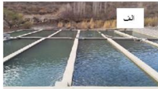
شکل ۱: الف: استخر پرورش ماهی منطقه سیرج ب: استخر پرورش ماهی منطقه کوهپایه Figure 1: A: Sirch area fisheries pool B: Kouhpayeh area fisheries pool