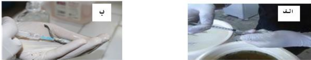
شکل ۲: الف و ب: تزریق میزان ۰/۱ میلی لیتر باکتری آئروموناس هیدروفیلا از رقت 10^{-4} و 10^{-8} درون صفاق ماهی قزل آلاهی رنگین کمان Figure 2: A and B: intraperitoneal injection of 0.1 ml Aeromonas hydrophila from 10^{-4} and 10^{-8} dilution to Rainbow Trout