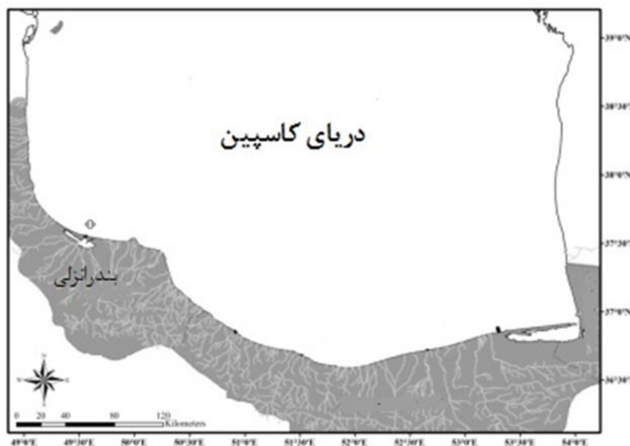
شکل ۱: منطقه و ایستگاه‌های نمونه برداری در دریای خزر- بندرانزلی، اردیبهشت ۱۴۰۲ Figure 1: Area and sampling stations in the Caspian Sea, Anzali- May 2023

برداشت نمونه، حجم مورد مطالعه و ضریب ثابت جمعیت در لیتر براساس روش‌های استاندارد انجام گرفت (APHA, 2005).