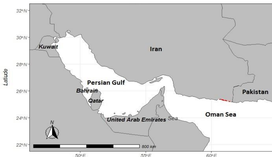
شکل ۱: موقعیت مناطق جمع آوری اطلاعات ماهی حلوا سیاه در ابهای جنوب کشور (خلیج فارس و دریای عمان) Figure 1: Location of data collection areas of Parastromateus niger in the (Persian Gulf and Oman Sea)

۴ برابر صید حداکثر به عنوان حداکثر ظرفیت حمل بعنوان ورودی مدل و C_y = صید در سری زمانی و سال y می‌باشد (Froese et al. , 2016). در این روش میزان مرگ و میر صیادی حداکثر محصول پایدار ۵ با کمک فرمول F_{msy} = r/2 و حداکثر محصول پایدار از فرمول MSY = rk/4 و زی توده حداکثر محصول پایدار ۶ B_{msy} = K/2 محاسبه می‌شود. وضعیت صیادی معمولاً براساس میزان شاخص زی توده موجود به زی توده حداکثر محصول پایدار (B/B_{MSY}) و همچنین میزان شاخص مرگ و میر صیادی موجود به مرگ و میر صیادی حداکثر محصول پایدار (F/F_{MSY}) ارزیابی می‌شود (Zhou et al. , 2017). به منظور آنالیزها و تجزیه و تحلیل‌های آماری از نرم افزارهای R studio (1.1.446) و SPSS (21) و سطح معنی داری ۰/۰۵ و حدود اطمینان ۹۵٪ استفاده شد.