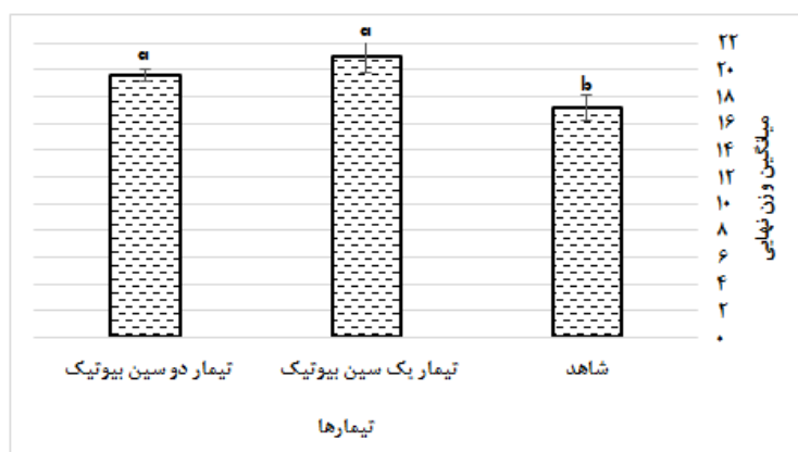
شکل ۱: مقایسه وزن نهایی بین تیمارها

مقایسه میانگین وزن نهایی بین تیمارها در پایان هفته هفتم در شکل (۱) نشان داده شده است. مقادیر وزن نهایی در هر دو تیمار یک و دو سین بیوتیک دارای افزایش معنی‌داری نسبت به گروه شاهد بودند ( p < 0.05 ). مقایسه شاخص‌های رشد و شاخص کبدی بین تیمارها در پایان هفته هفتم در شکل (۲) نشان داده شده است. طبق شکل